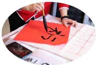
红红火火庆新春—写福字活动