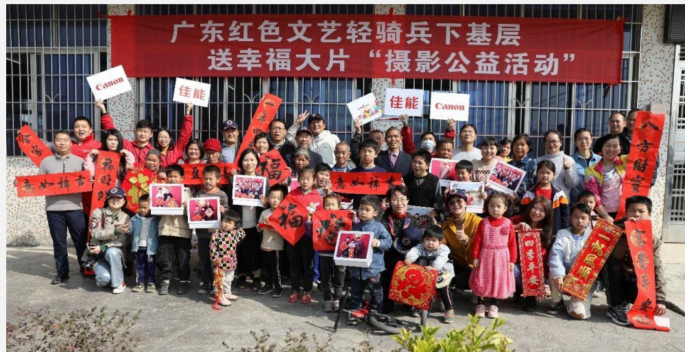
2021年“我们的中国梦 送幸福大片”摄影公益活动全家福

2021年1月23日，佳能（中国）有限公司广州分公司、广东新快报、广东省摄影家协会等单位再度携手，联合启动了“我们的中国梦，送幸福大片”摄影公益活动。自2011年初次举办，“送幸福大片”活动至今已经走过十一个年头。今年，活动走进英德市大塘镇大塘村，记录下200多副村民们的幸福笑脸，为他们送上一份特殊的新年祝福。