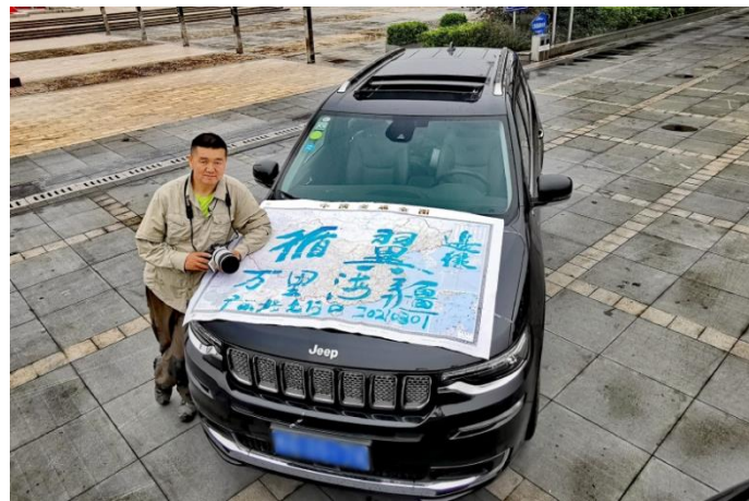
中国著名自然地理摄影师、影像艺术家边缘

2021年3月，由佳能提供摄影器材支持的“循翼|万里海疆”海岸生态研究保护活动，在广西省北仑河口国家级自然保护区正式启动。本次活动由中国著名自然地理摄影师、影像艺术家边缘发起并掌镜，边缘将在67天内自驾途经11座沿海城市，从广西北仑河口一路北上至辽宁鸭绿江口，拍摄记录沿途鸟类的生活状态。