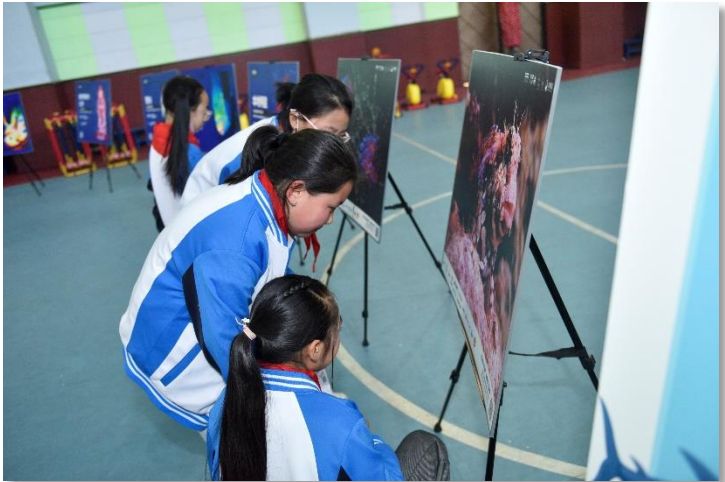
孩子们在认真看展，认识海洋生物

活动为期5天，一共三站，分别是汶川第二小学、汶川第一小学和汶川特殊教育学校。本次海洋公益活动主要是通过影展和讲座的形式让更多的学子们认识海洋、了解海洋，结合一些有意思的互动环节，让这群看不到海的学生们对于海洋有着深深的向往。通过观看影展、公益讲座、手工制作等环节，汶川的学生们了解了许多海洋知识，也把保护环境的概念植入了脑海中。