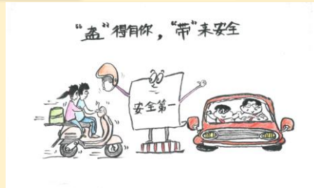
部分获奖作品赏析