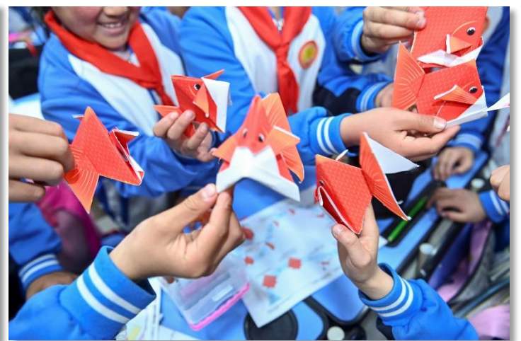
学生们在兴高采烈地体验 Creative Park的海洋折纸

近些年气候变化、海洋酸化，让珊瑚礁面临愈发巨大的危机，而很多伤害甚至是不可逆的。巴黎协议中提出到2030年，实现保护30%的海洋，保护珊瑚礁的窗口期就在接下来的这几年。2021年作为保护生物多样性非常关键的一年，一系列相关国际会议都会关注气候变化及生物多样性，希望通过各项举措，来加强海洋保护及气候保护。为了孩子为了海洋，让我们共同呼吁爱护我们所生存的这颗“蔚蓝星球”。