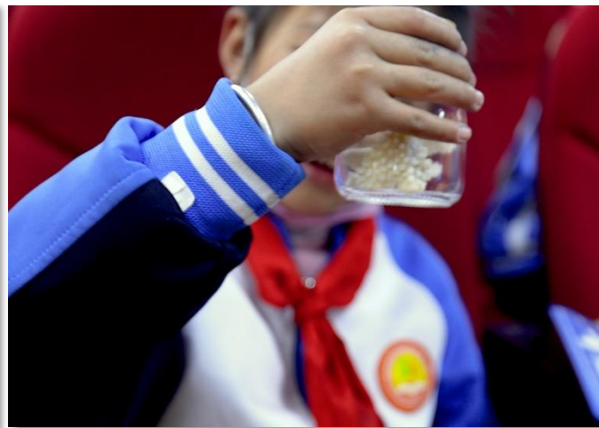
公益讲座环节中，学生们在仔细地研究生态瓶