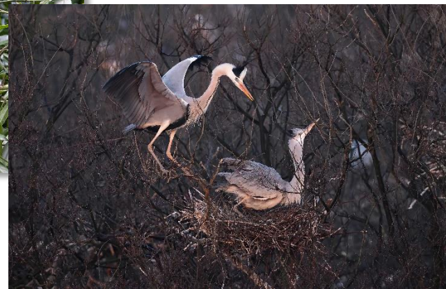
肖戈使用佳能设备拍摄的作品