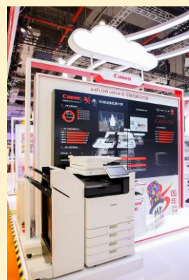
uniFLOW online & 印量包解决方案