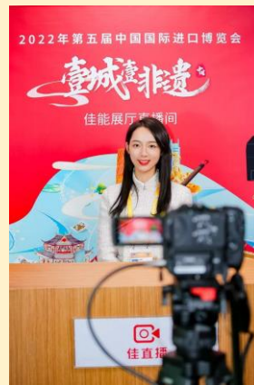
佳直播高画质直播解决方案