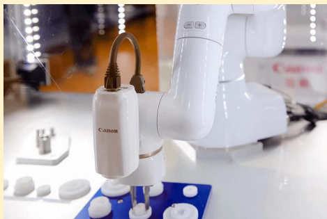
佳能大连的工厂自动化技术解决方案和注塑模具新技术