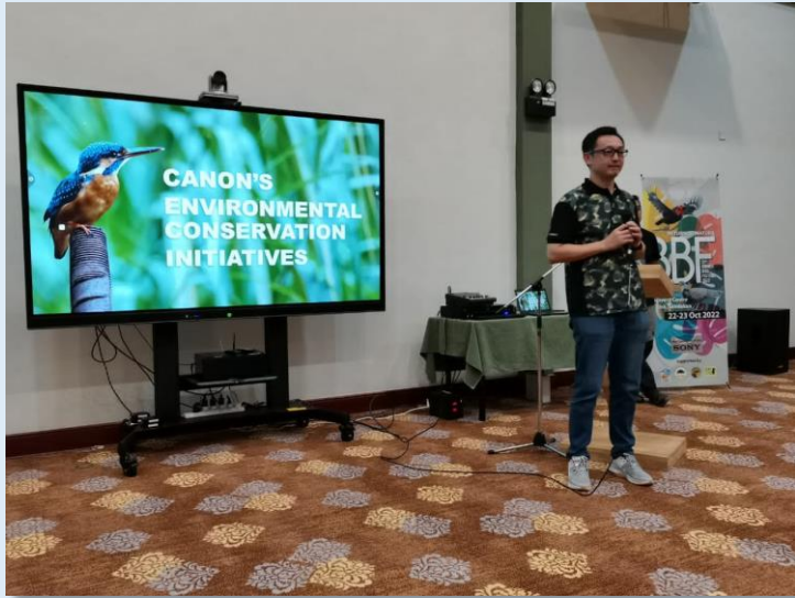
佳能销售（马来西亚）分享佳能环保工作

10月22日、23日，婆罗洲鸟类节在山打根Sepilok的雨林探索中心举行，佳能销售（马来西亚）照相机部门团队前往参加。本活动由山打根婆罗洲鸟类俱乐部主办，沙巴旅游局赞助，是一年一度纪念婆罗洲土生土长鸟类的观鸟节，它既鼓励生态旅游，又提出野生动物保护问题。在为期两天的活动中，举办了各种各样的活动，包括佳能销售（马来西亚）赞助的近4500令吉（RM）的鸟类摄影比赛。