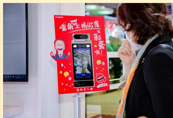
笑脸识别门禁解决方案

佳能将不断拓展新的业务方向，利用自身影像优势，为行业及个人用户带来更加多元化的解决方案，不断满足中国客户的需求。同时佳能也将继续观察落实“共生”理念与“大笑”企业文化战略，与中国社会共生共赢。