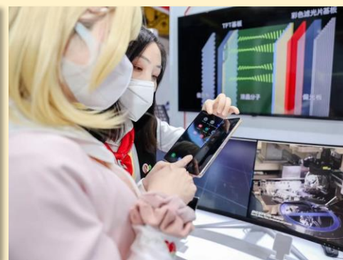
光学半导体产业设备 应用于折叠屏手机