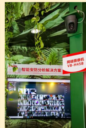
智能安防分析解决方案