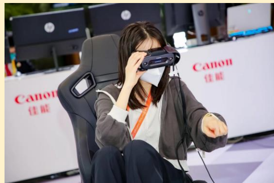
佳能全新MR（融合现实）系统