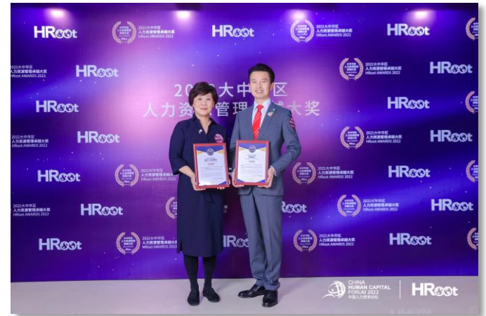
“2022大中华区卓越雇主”及“2022大中华区最佳人力资源团队”奖项