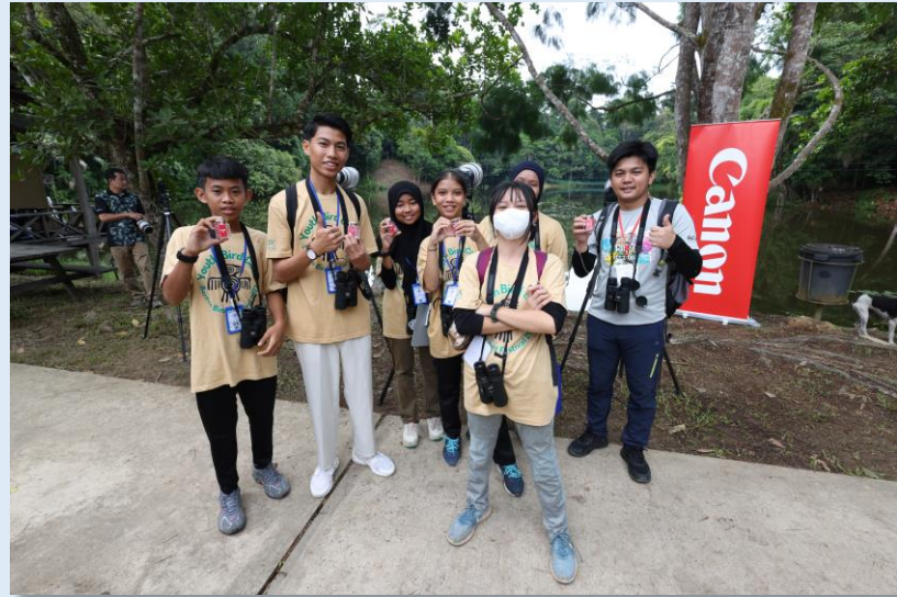
参观佳能展区的观鸟人

通过积极组织参与观鸟活动，佳能销售（马来西亚）将继续致力于环保活动，为保护生物多样性而努力。