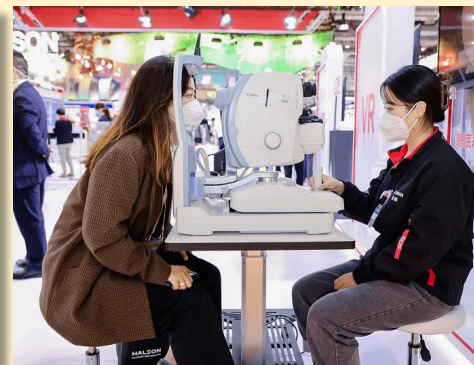
佳能EOS医用相机技术 搭配AI眼底诊疗技术， 透过眼底看健康